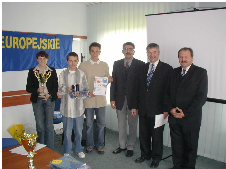
II miejsce Gimnazjum w Opolu Lubelskim,