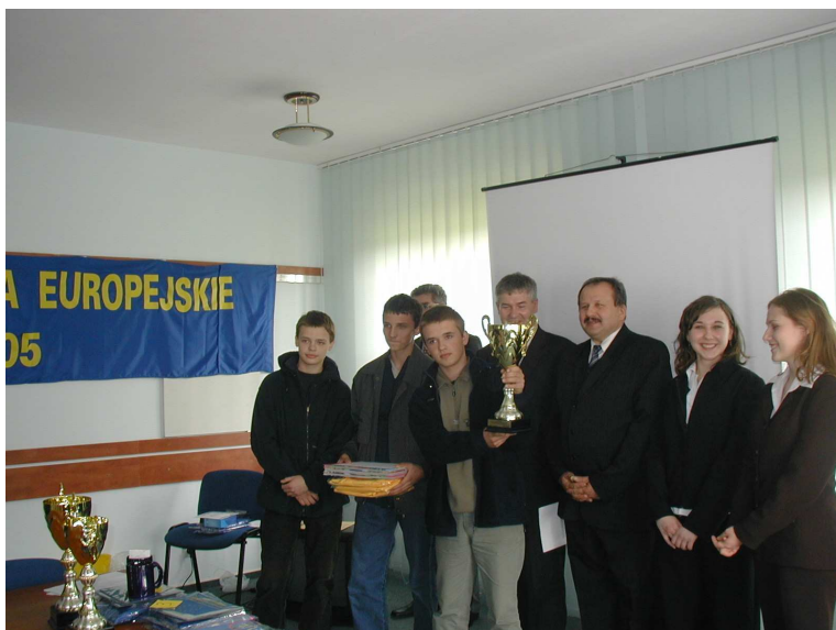
I miejsce Gimnazjum w Ostrówku,