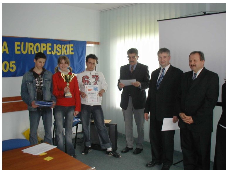
III miejsce Gimnazjum w Łucce